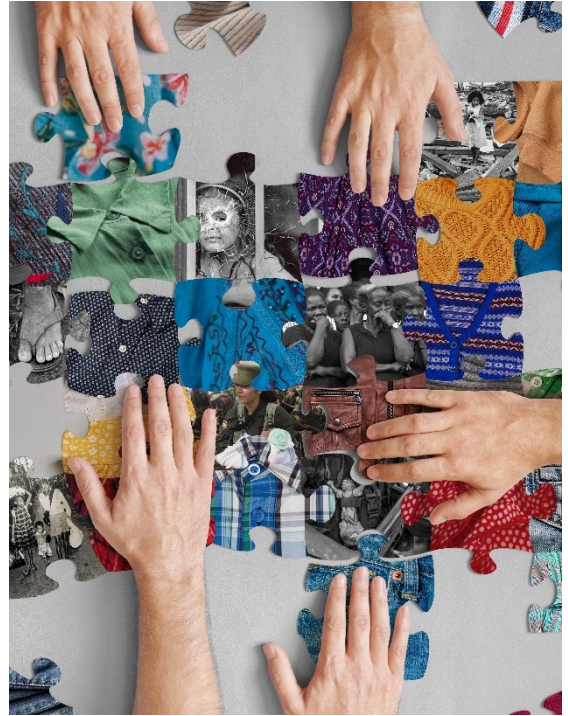
Ilustración 1 Reconstruyendo memorias. Diagramación Sebastián Piedrahita

Lo segundo, porque al reconocernos como seres humanos con horizontes de sentido diversos e historias compartidas, podemos encontrarnos y poetizar la memoria como un acto de convivio, una invitación a comprometer los cuerpos, las memorias, las huellas, las cicatrices de quienes lo presencian como artistas, como espectadores, se refiere a la presencia física y espiritual. (Grisales, 2016)